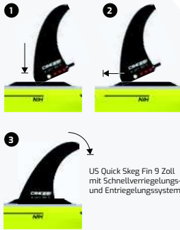
US Quick Skeg Fin 9 Zoll mit Schnellverriegelungs- und Entriegelungssystem.

Solid wurde entwickelt, um die Anforderungen an ein sehr widerstandsfähiges, starres und sicheres aufblasbares Board zu erfüllen. Diese SUP sind speziell für Wassersportzentren und für den professionellen Verleih konzipiert, wobei in der Kollektion die stärkere Technologie zu finden ist.